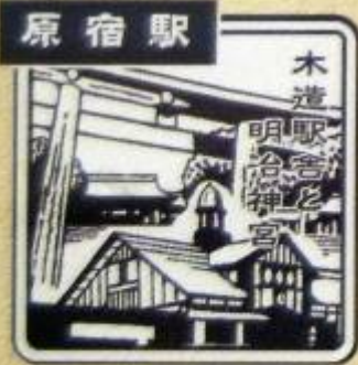
はらじゅく 表参道口 みどりの窓口前