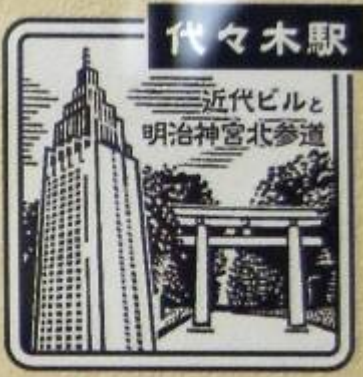
よよぎ 西口 みどりの窓口内