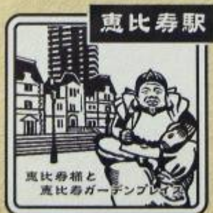
えびす 西口 みどりの窓口前