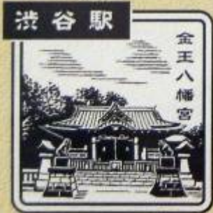
しぶや 南口 みどりの窓口内