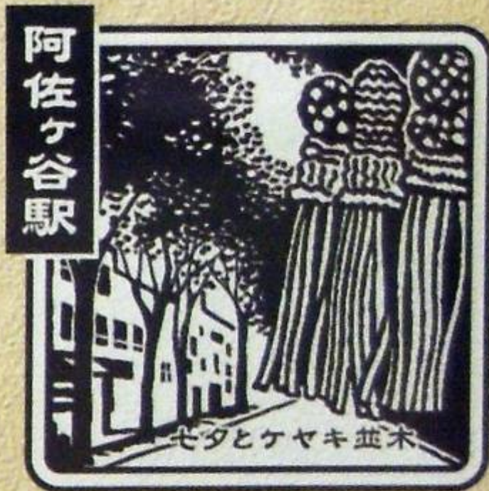
あさがや 東口 キヨスク横