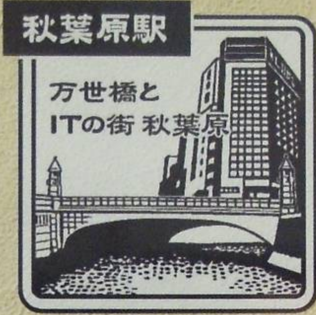
あきはばら 電気街口 みどりの窓口内