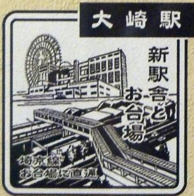
おおさき 北改札口前