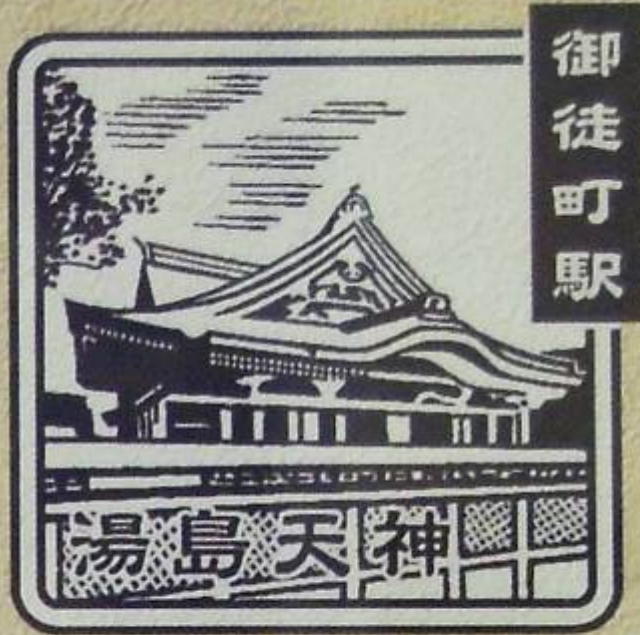
おかちまち 北口 VIEW ALTTE横