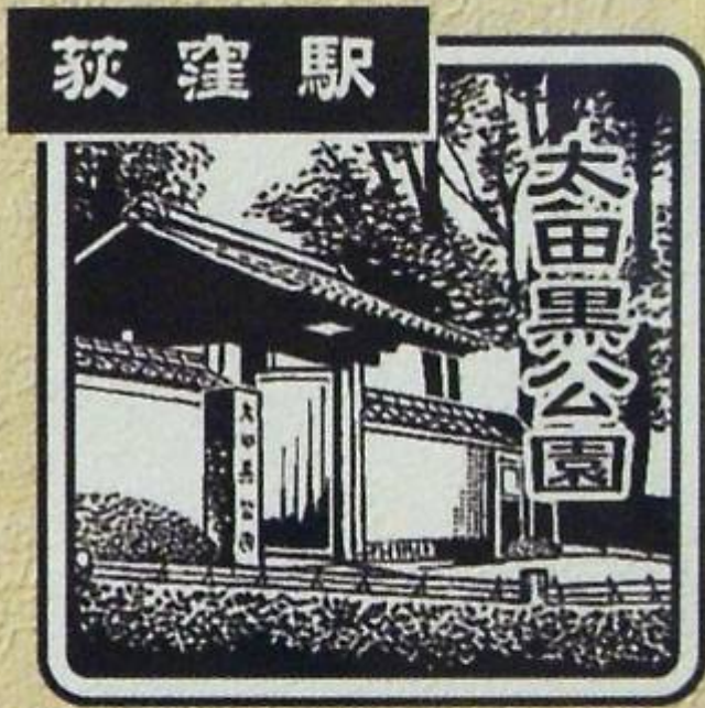
おぎくぼ 東口 みどりの窓口前