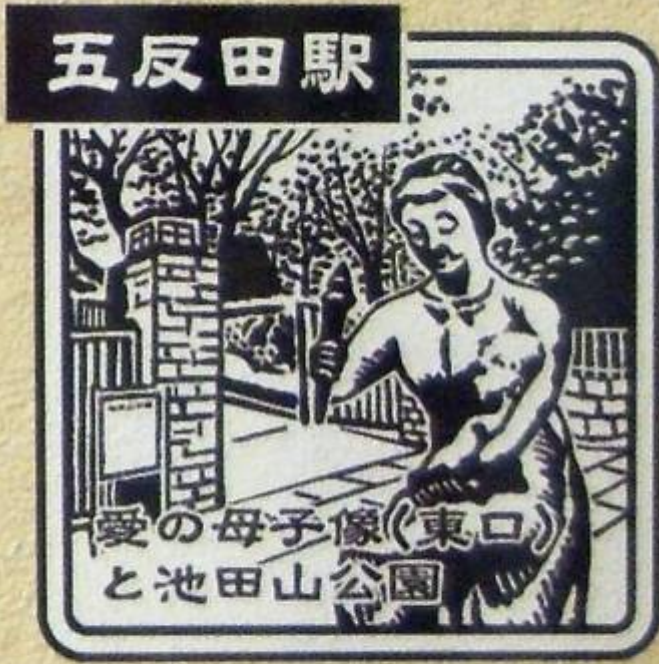
ごたんだ 西口側改札脇